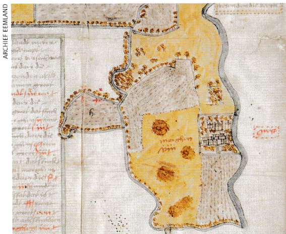
Het goed Randenbroek opgemeten en in kaart gebracht in 1562 (detail Kaart_015).

In 1626 werd Jacob van Campen eigenaar van het goed Randenbroek. Het huis lijkt te bestaan uit twee delen, met drie schoorstenen. Zo is te zien op een kaart uit 1562 (Kaart_015, Archief Eemland) waarbij het noorden onder is. Rechts loopt de Heiligenbergerbeek ( beeck ) en in het midden slingert een voetpad, de Heiligenbergerweg, omzoomd met bomen. Ten oosten van het huis (links) liggen drie bruine rondjes; het zijn waarschijnlijk natuurlijke heuvels of 'bergjes', ontstaan ongeveer 10.000 jaar geleden, toen de wind in de laatste ijstijd zandduinen opwierp in het nog onbegroeide landschap. Deze heuveltjes zijn nog steeds markante punten in het huidige Park Randenbroek.