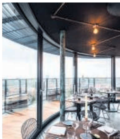
▲ In Utrecht is in de watertoren nu een restaurant.

Binnenkort wordt de vloer geëgaliseerd en voorzien van vloerverwarming. „Ik verwacht dat we over een jaar al heel ver zijn met een nieuwe huurder. Als de bestemming eenmaal gewijzigd is, kan het snel gaan.”